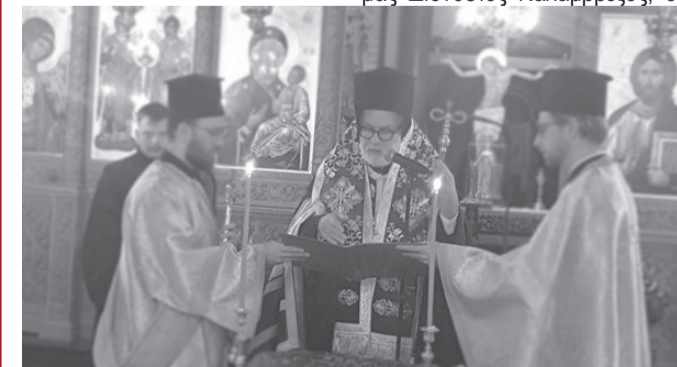
Άποψη από την τελετή.

Στην εκδήλωση της κοπής, παραβρέθηκαν και διάφορες προσωπικότητες, ο Πρέσβης μας Διονύσιος Καλαμβρέζος, ο