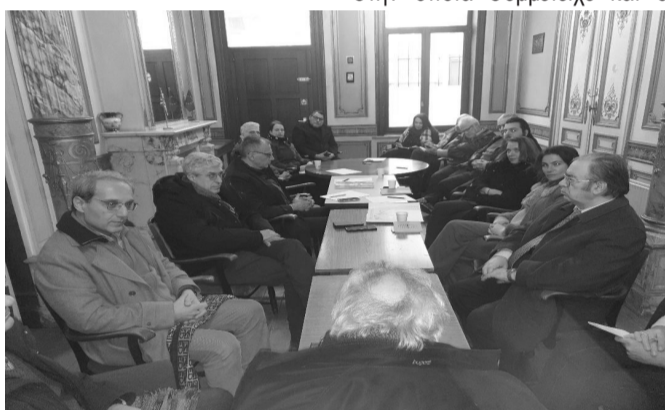
Μερική άποψη από την σχετική συνάντηση των φορέων