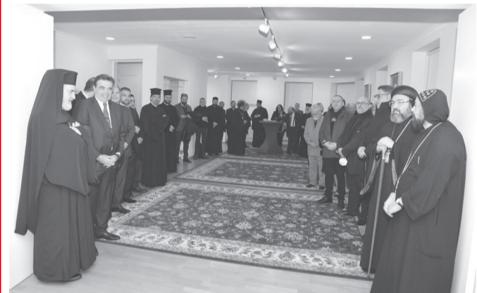
Άποψη από Τα εγκαίνια του «Ορθόδοξο Κέντρου Ambiorix»

Ακολούθησε ανάγνωση, ειδικού για την περίπτωση μνημόματος, του Οικουμενικού Πατριάρχη κ.κ. Βαρθολομαίου, από το Θεοφιλέστατο Επίσκοπο Απολλωνιάδος κ. Ιωακείμ, βοηθού Επισκόπου