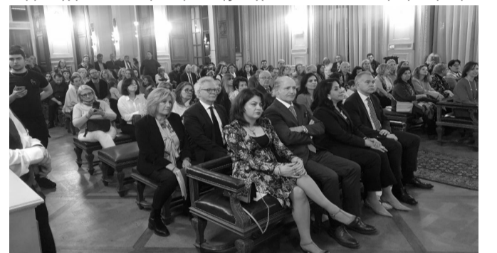
Άποψη από την εκδήλωση

στην αίθουσα εκδηλώσεων και τελετών του Δήμου Saint-Gilles, την οποία παραχώρησε ο Δήμαρχος κ. Jean Spinette, ως συμβολική συμμετοχή στον εορτασμό της