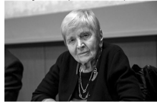
Η Ελένη Γλύκατζη-Αρβελέρ

Η Ελένη Γλύκατζη-Αρβελέρ άλλαξε ουσιαστικά την ιστορική εικόνα του Βυζαντίου, καθώς συνέβαλε καθοριστικά