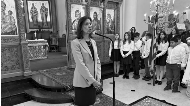
Η Πρέσβειρα της Ελλάδας και Γραμματά

ναγόρα. Η ημέρα συνέδεσε με ιδιαίτερα ουσιαστικό τρόπο το πνεύμα της Μεγάλης Τεσσαρακοστής με τη μνήμη της εθνικής παλιγγενεσίας.