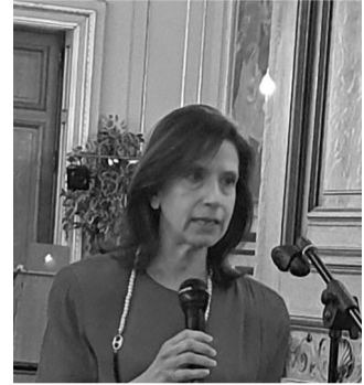
Η Πρέσβειρα της Ελλάδας κα Σοφία Γραμματά

Στη συνέχεια ακολούθησε η ομιλία της Ιστορικού Τέχνης της Εθνικής Πινακοθήκης – Μουσείου Αλεξάνδρου Σούτσου, κας Λαμπρινής Καρακούρη-Ορφανοπούλου, με τίτλο «Η μνήμη του Αγώνα μέσα από το έργο των Ελλήνων καλλιτεχνών», σε συνδυασμό με την προ-