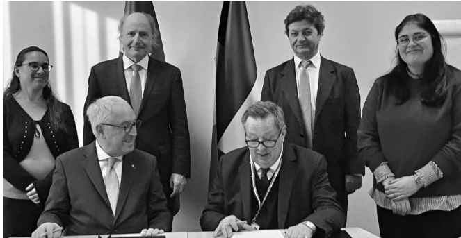
Ο Πρόεδρος Francois de Kerchove d'Exaerde κ. ο Διευθυντής του EPLO Καθηγητής Σπύρος Φλογαίτης κατά την υπογραφή της συμφωνίας

Ο EPLO, εκτός από την έδρα του στην Αθήνα, διαθέτει Παραρτήματα, Περιφερειακά Παραρτήματα και Γραφεία στη Ρώμη, στη Μαριούπολη, στην Οδησό, στο Τρέντο, στο Κασκάις, στην Τιφλίδα,