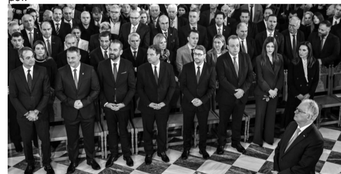
Οι επίσημοι προσκεκλημένοι κατά την τέλεση του τρισάγιου

Με ιδιαίτερη λαμπρότητα εορτάστηκε φέτος στο Μεσολόγγι η επέτειος των 200 χρόνων από την ηρωική και ιστορική έξοδο, στην οποία παραβρέθηκαν πολλοί επίσημοι.