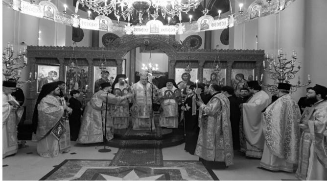
Αποψη από το Συλλείτουργο

Με λαμπρότητα και σε κλίμα βαθιάς συγκίνησης εορτάστηκε την Κυριακή 1η Μαρτίου 2026 η Κυριακή της Ορθοδοξίας στον Ιερό Μητροπολιτικό Ναό των Παμμεγίστων Ταξιαρχών Βρυξελλών, με το καθιερωμένο Διορθόδοξο Συλλείτουργο. Πρόκειται για έναν θεσμό που τηρείται από το 1983 και έχει