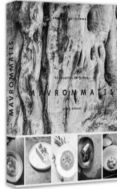
Εξώφυλλο του βιβλίου

Στο νέο του βιβλίο ο Ανδρέας Μαυρομάτης αποκαλύπτει 45 συνταγές, και παρουσιάζει πιάτα όπως: «Ραβιόλια με κρόκο Κοζάνης και γέμιση τύπου σπανακόπιτας», «Χοιρινό μάγουλο με κυδωνί και ρετσίνα», «Ντολμάδες με σαλάχι, σάλτσα ντομάτα και καππαρόφυλλα Κύπρου», «Καρπούζι και φέτα με χυμό από ραβέντι