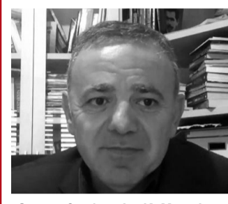
Ο ευρωβουλευτής Κ. Μαυρίδης

Κώστας Μαυρίδης- Ευρωβουλευτής ΔΗΚΟ (S&D) - Πρόεδρος Πολιτικής Επιτροπής για την Μεσόγειο costas.mavrides@europarl.europa.eu