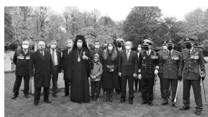
Από την κατάθεση στεφάνων στο κοιμητήριο των Βρυξελλών

στηρών περιοριστικών μέτρων για την αποφυγή της περαιτέρω εξάπλωσης του κορωνοϊού.