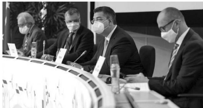
Αποψη από τη Σύνοδο της Ολομέλειας της Ευρωπαϊκής Επιτροπής των Περιφερειών

Η Σύνοδος της Ολομέλειας της Επιτροπής των Περιφερειών, πραγματοποιήθηκε στις 12 Οκτωβρίου, παρουσία της Προέδρου της Κομισιόν Ursula von der Leyen, όπου ο Πρόεδρος της Ευρωπαϊκής Επιτροπής των Περιφερειών και Περιφερειάρχης Κεντρικής Μακεδονίας, Απόστολος Τζιτζικώστας, παρουσίασε το πρώτο ετήσιο Βαρόμετρο των Περιφερειών και Δήμων της ΕΕ 2020, δηλαδή την Κατάσταση των Περιφερειών και των Δήμων της Ευρώπης.